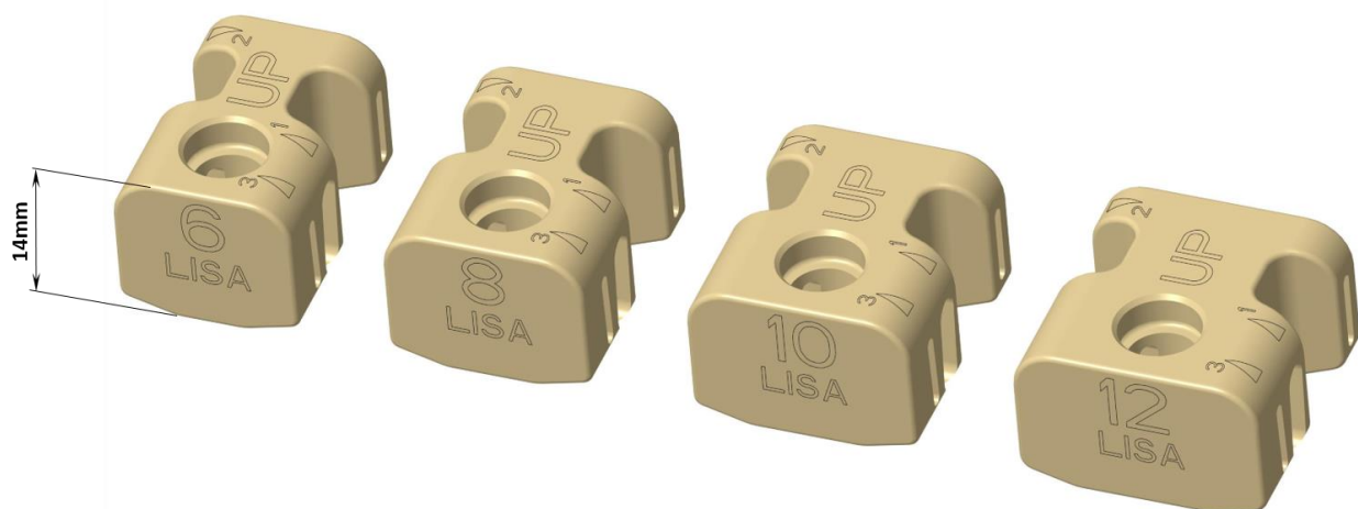
Obrázek 3.1-1: Obrázek distanční vložky LISA, který je dostupný ve čtyřech velikostech